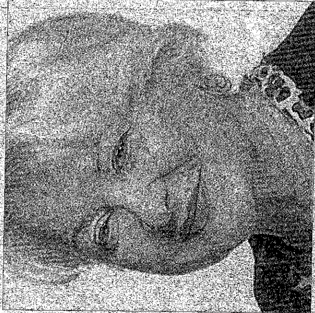
Plus de 40 ans de carrière pour Josiane Balasko, toujours aussi populaire.

Opéra-théâtre d'Avignon le 1 er octobre à 20h30. Infos et resa : 04.90.82.81.48