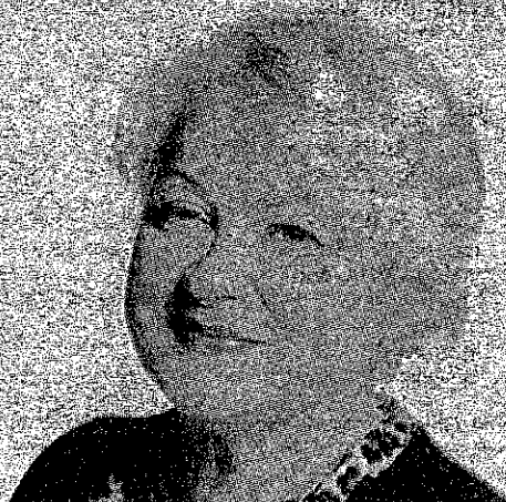
Josiane Balasko ouvrira la saison dans sa propre pièce.

Location au 04 90 14 26 40 ou sur www.operagrandavignon.fr