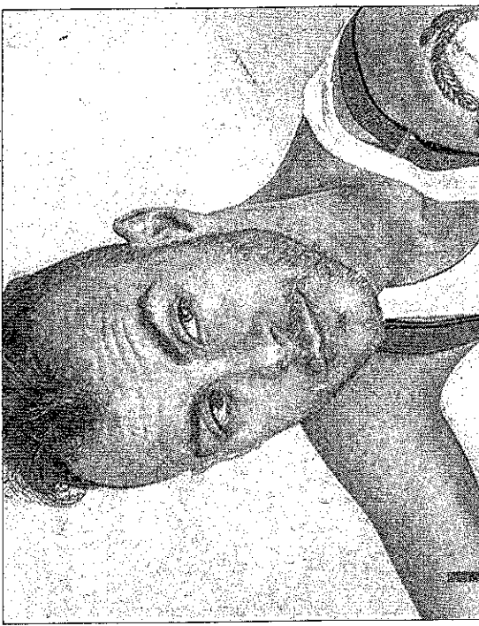
A 34 ans, Asaf Avidan, auteur du tube "Reckoning song", entend revenir sur scène dans des lieux plus intimistes.

dernier le Grand Prix de la Presse Musicale Internationale. Il a choisi de diriger sur instruments d'époque les deux ultimes chefs-d'œuvre de Mozart : le Concerto pour clarinette en la majeur K.622 et le Requiem K.626 , l'un composé avant sa mort, et l'autre, pièce énigmatique laissée inachevée par un compositeur au sommet de son art. García Alarcón propose une vision davantage tournée vers l'héritage baroque, plus conforme, selon lui, aux volontés de Mozart. Samedi à 20h30 et dimanche à 17h à l'Opéra Grand Avignon; places de 5,50 à 44 €