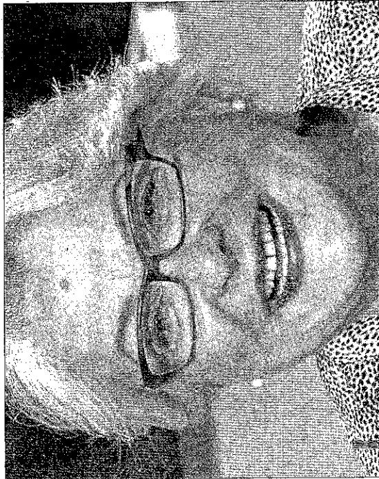
Josiane Balasko passe ses vacances dans sa maison du Luberon et a tourné "Gazon maudit" à Avignon et à Villeneuve.

Première semaine de saison fracassante : Balasko ce mercredi, Asaf Avidan jeudi et Mozart samedi et dimanche