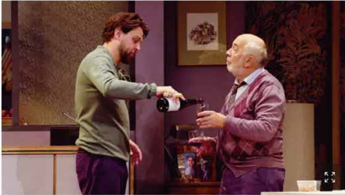
Arthur et Gérard Jugnot dans Le Jour du kiwi au Théâtre Édouard VII