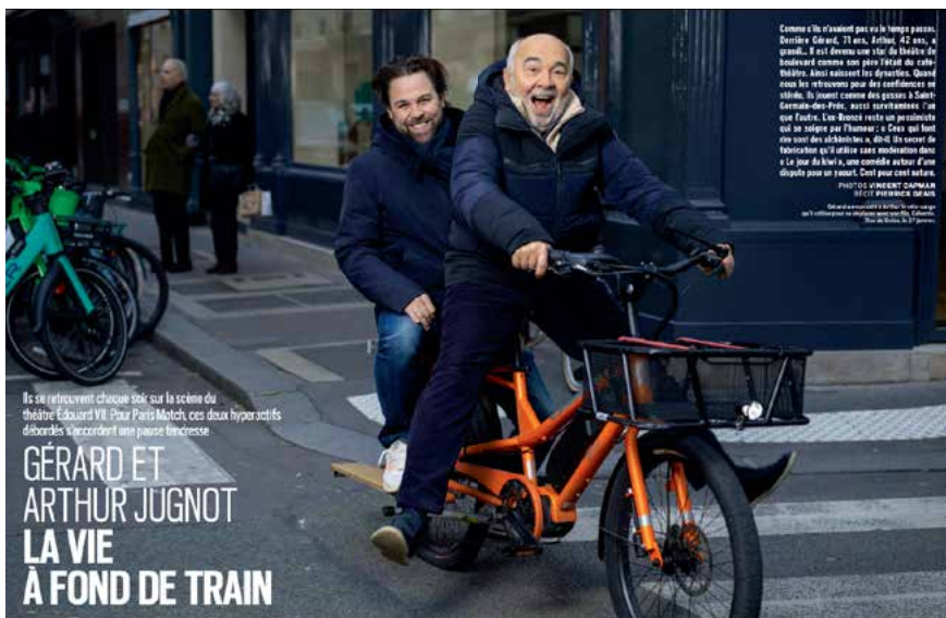
Ils se retrouvent chaque soir sur la scène du théâtre Édouard VII. Pour Paris Match, ces deux hyperactifs débordés s'accrochent une pause française