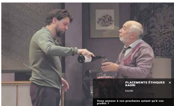
Père et fils au Théâtre Édouard-VII.