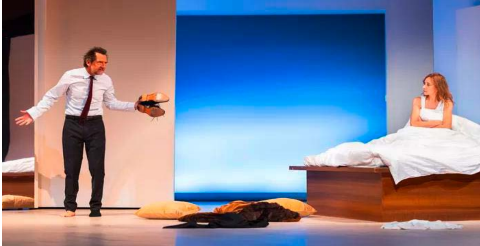
«La Vérité», avec Stéphane De Groodt et Sylvie Testud.

Publié le 17 février à 14h51, mis à jour le 17 février à 14h52