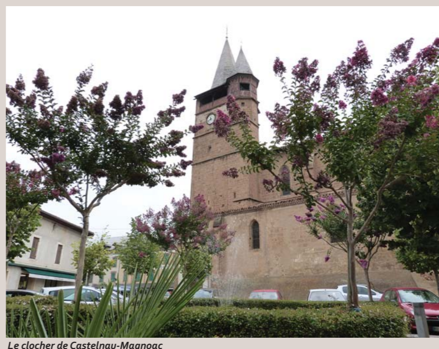
Le clocher de Castelnaud-Magnoac