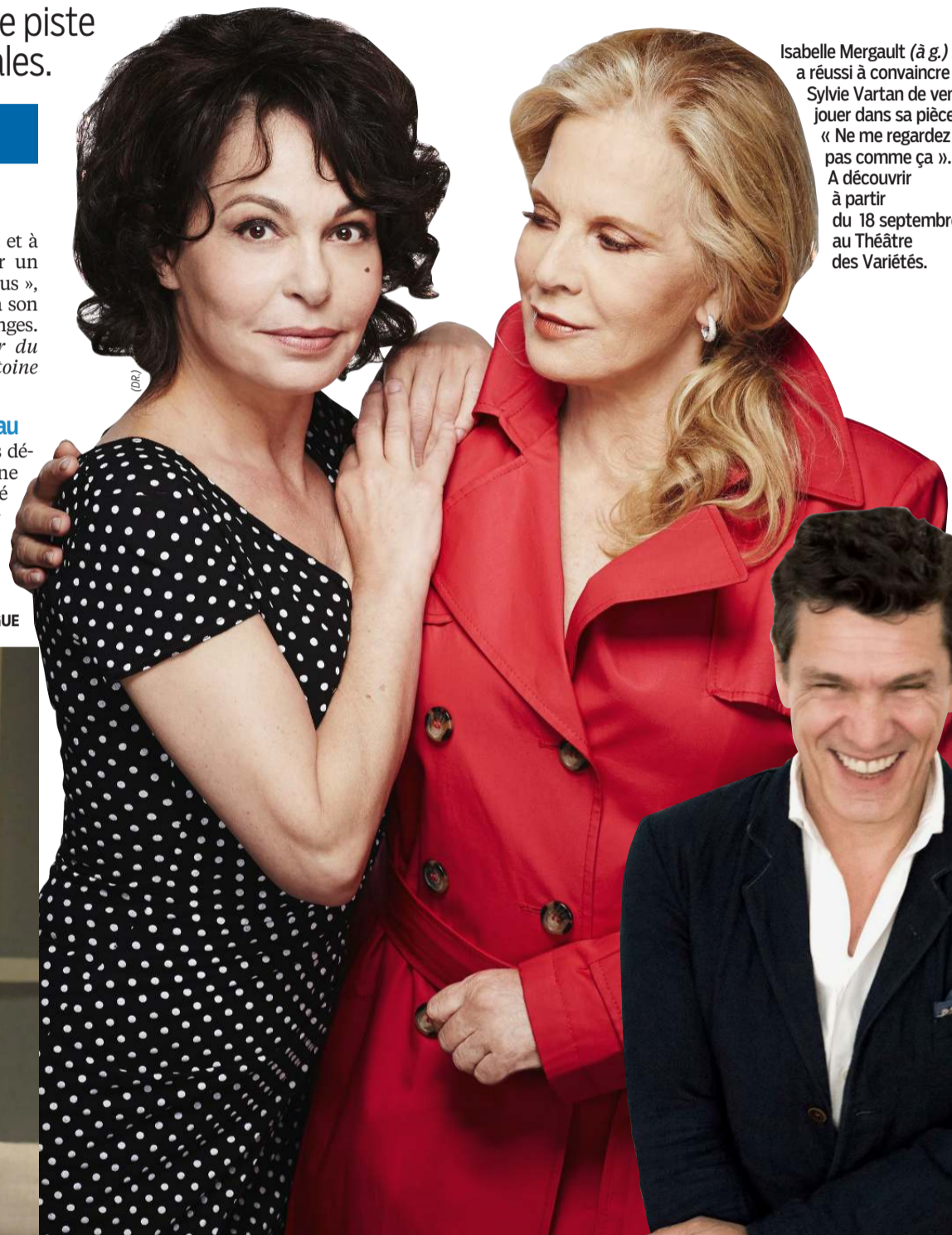
Isabelle Mergault (à g.) a réussi à convaincre Sylvie Vartan de venir jouer dans sa pièce « Ne me regardez pas comme ça ». A découvrir à partir du 18 septembre au Théâtre des Variétés.