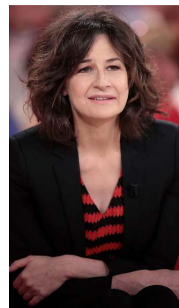
Valérie Lemerrier effectue son retour au Théâtre du Châtelet.

■ Valérie Lemerrier s'offre le Châtelet. Après Florence Foresti, la prestigieuse salle parisienne accueille la réalisatrice de « Palais royal ! » pour son très attendu come-back en solo. On annonce des sketches, de la danse, de la folie : du Lemerrier, quoi ! Du 1 er octobre au 8 novembre au Théâtre du Châtelet, Paris I er . Tél. 01.40.28.28.28.