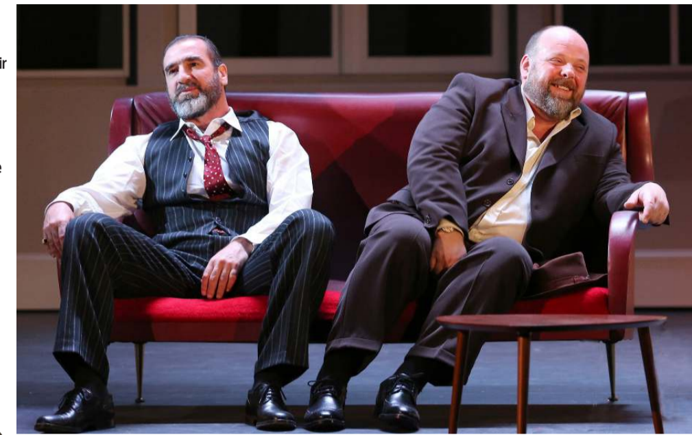
Au côté de Grégory Gadebois (à dr.), l'ancien footballeur Eric Cantona (à g.) incarne un homme d'affaires des années 1950 dans « Victor ». Une pièce mise en scène par sa femme, Rachida Brakni.