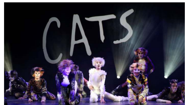
Le spectacle « Cats » revient en France et en VF au Théâtre Mogador après avoir triomphé dans le monde entier.

■ Paris chante sous la pluie. « Singin' in the Rain » arrose le Châtelet pour cinq semaines. Une adaptation du film de Gene Kelly et Stanley Donen. A partir du 27 novembre au Théâtre du Châtelet, Paris I er . Tél. 01.40.28.28.28. T.D.